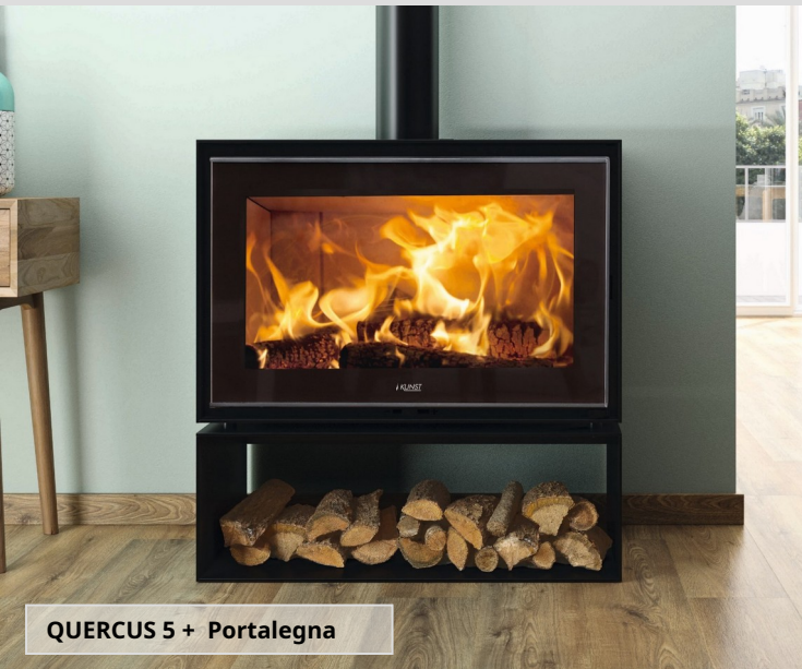
QUERCUS 5 + Portalegna