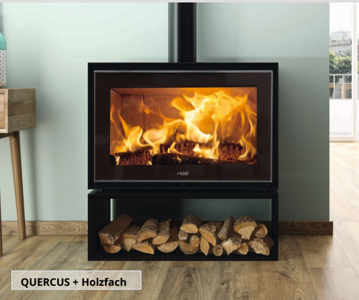
QUERCUS + Holzfach