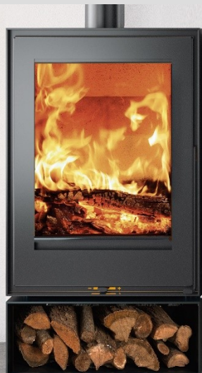
SEQUOIA + Holzfach