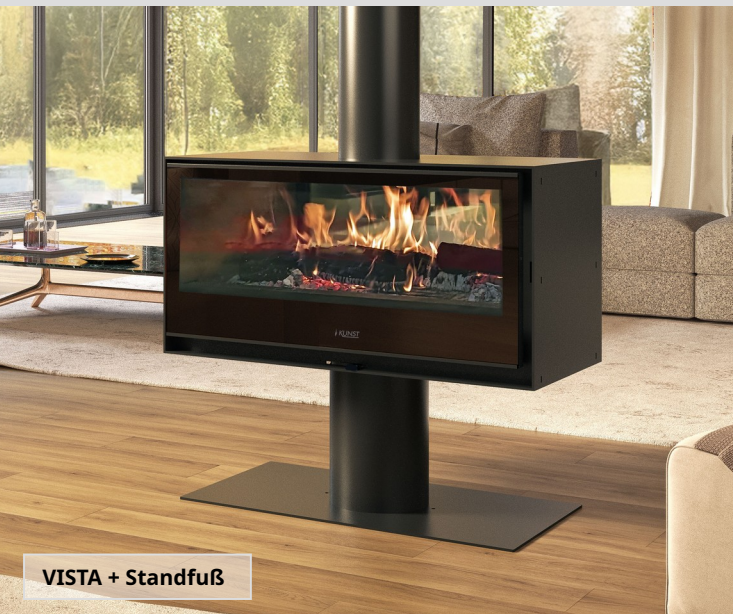
VISTA + Standfuß