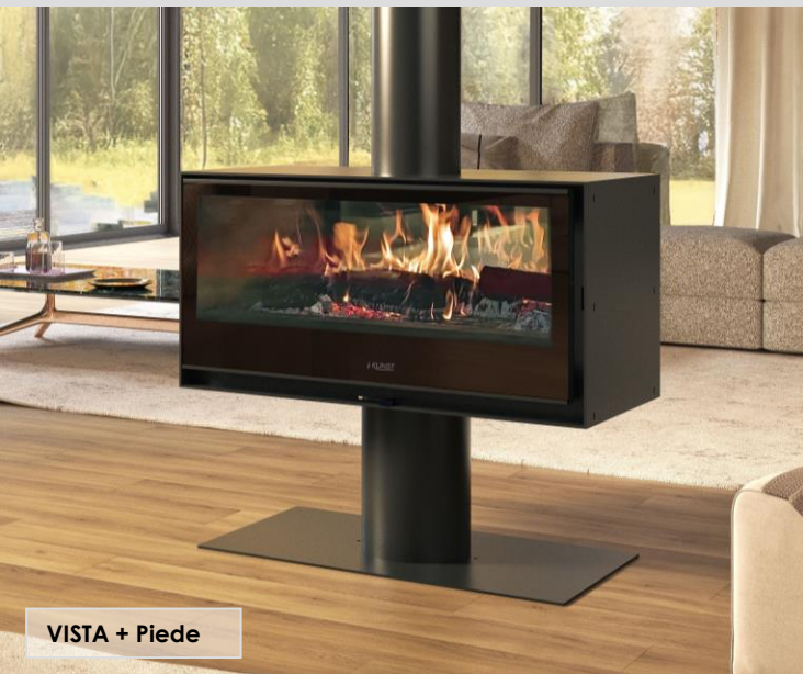
VISTA + Piede